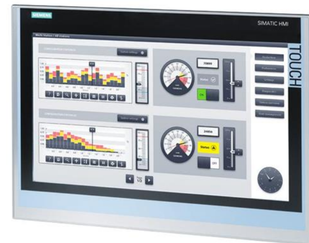
SIMATIC HMI TP1900

Consolas HMI compatible con TIA Portal Versión 16,17,18 , Servicio web